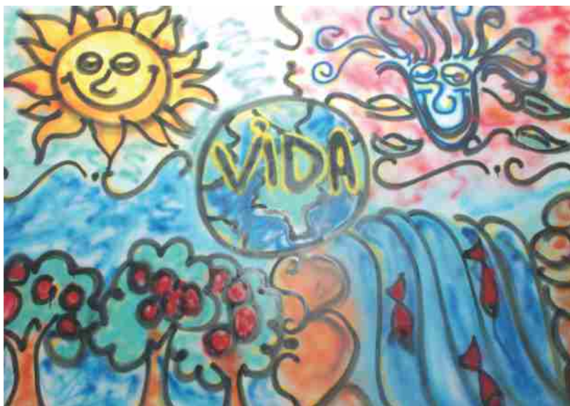
Tela Grafitada na I Conferência Estadual Infanto-juvenil pelo Meio Ambiente Salvador - BA

É importante destacar que todas as orientações citadas anteriormente devem estar de acordo com as premissas da sustentabilidade socioambiental buscando, principalmente, promover a reflexão e/ou soluções para melhorar o espaço, a gestão e o currículo escolar.