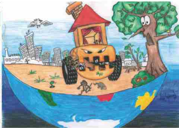
Escola Gênese Salvador - BA