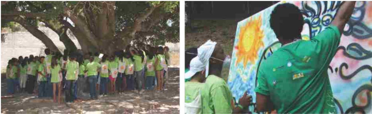
Acolhida e Oficina de Grafitti na I Conferência Estadual Infanto-juvenil pelo Meio Ambiente | Salvador - BA

Esses desafios estão postos, mas como resolvê-los? Como superá-los a fim de não reproduzir os caminhos já consolidados na educação? Tais questionamentos estão sendo amplamente discutidos nos espaços da educação e não existe uma “receita” a ser adotada, porém alguns caminhos têm sido vislumbrados pelos esforços de pesquisadores, docentes, gestores, estudantes e sociedade civil organizada em todo o Estado.