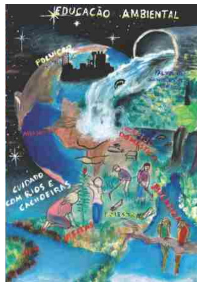
Escola Estadual Elysis Athaide Salvador - BA