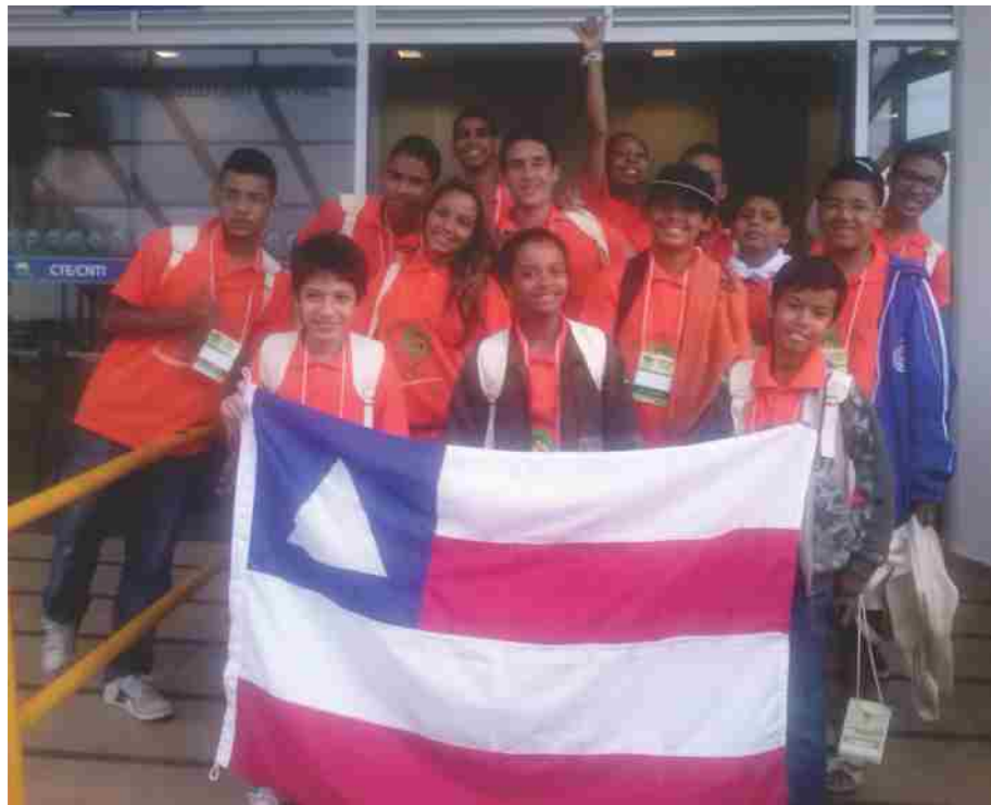
Delegação da Bahia na VI Conferência Nacional Infanto-juvenil pelo Meio Ambiente Brasília - DF