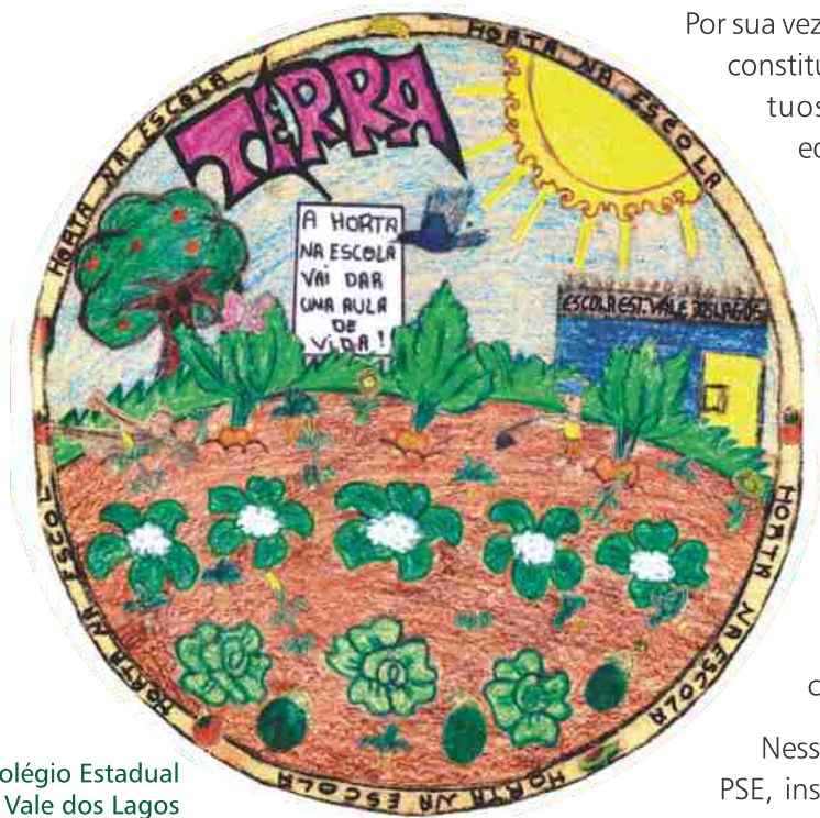
Colégio Estadual Vale dos Lagos Salvador - BA

Por sua vez, a saúde como campo social, também se constitui de modo complexo, diverso e conflituoso. Historicamente, a relação entre educação e saúde, por meio da educação em saúde e da outrora denominada educação para a saúde (WERNER, 2001), expressa tendências que vão desde a culpabilização do indivíduo por comportamentos prejudiciais à saúde, a uma leitura de mútua determinação entre indivíduo e sociedade na definição das condições de promoção da saúde, passando por abordagens centradas na transmissão de conhecimentos como fator preponderante para uma conduta culturalmente aceita como saudável.